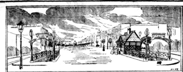
Die soeben vollendete Station Wittenberger Platz der Berliner (Hoch-) und Untergrundbahn.