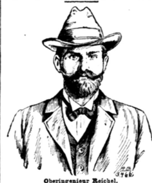
Oberingenieur Reichel, Erbauer der Berliner Hoch- und Untergrundbahn.